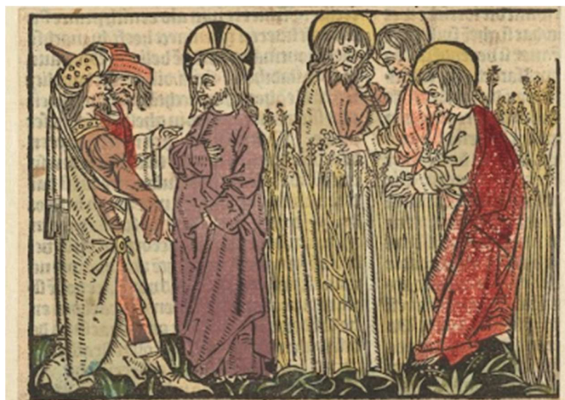
De discipelen plukken en eten aren, door Meester van Antwerpen, 1485-1491

Graag uw naam en postcode vermelden, alsmede de bestemming collecte: "Beheer en onderhoud Purmerkerk".