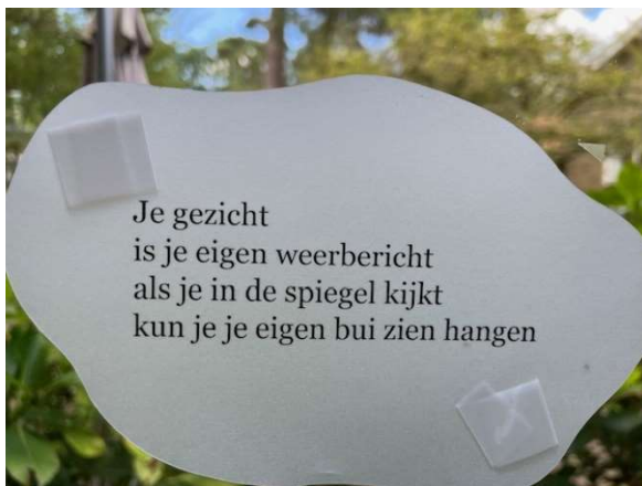
Op een raam in het verpleeghuis Leenders Mees in Bilthoven

Diet Groothuis in: heel de wereld wordt wakker, het beste van moderne kolderpoëzie